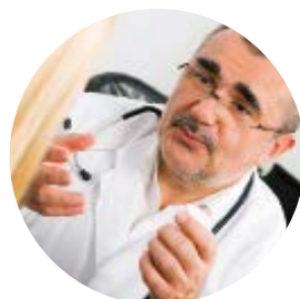
Médecin du travail